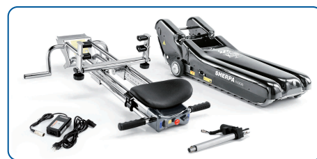
Transportable en piezas.